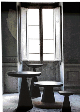
Misa: tavolini in vetroresina in 4 misure.