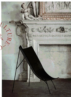
Ombro: sedute in vetroresina di Verter Turroni.

Una bottega familiare, che dà vita a collezioni dove il difetto è un'opportunità creativa. La prossima sfida? Arredare luoghi dimenticati.