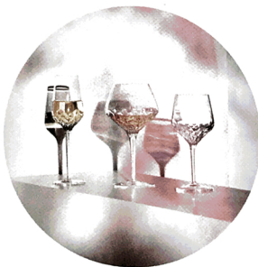
Qui sopra, una serie di calici della nuova collezione Folia di Saint-Louis.

Noé Duchaufour-Laurance, per la sua prima collezione per Saint-Louis, influenzato dal paesaggio delle foreste che cingono da ogni parte la manifattura, ha disegnato Folia , una linea di 25 pezzi di art de la table. Un'alleanza tra lucentezza del cristallo e forza naturale della natura. Come racconta lo stesso designer: «Mi sono ispirato a una foglia che si dispone in modo geometrico all'infinito, che sembra quasi sorvolare il cristallo». A.L.